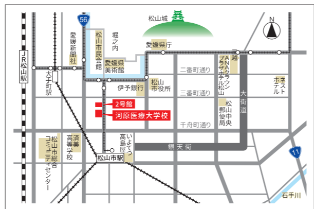
伊予鉄松山市駅より徒歩3分